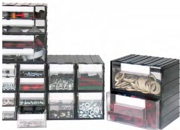
CARTELLINI IN DOTAZIONE STANDARD